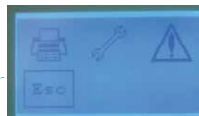
Détails de l'écran tactile