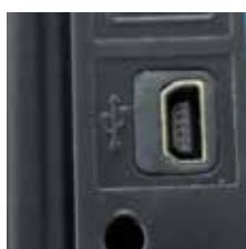
Illustration du raccordement USB